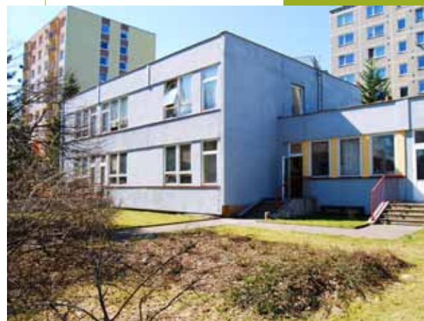
Foto: Pohled na budovu Fokusu v Nezvalově ulici