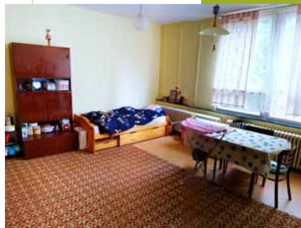
Foto: jeden z pokojů podporovaného bydlení

Služba je poskytována jako terénní a ambulantní.